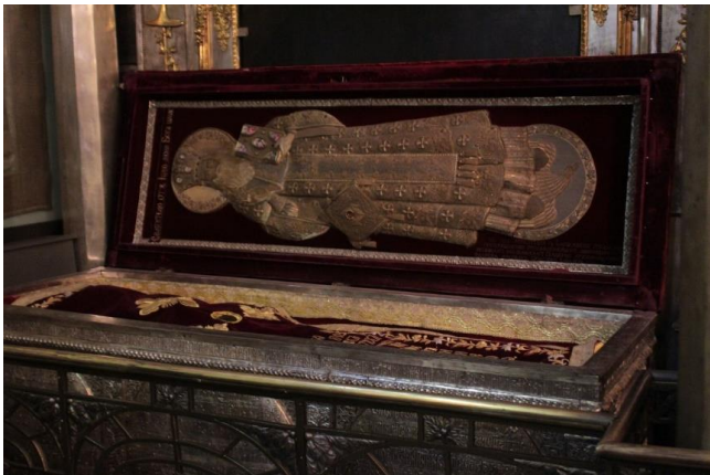
Мощи свт.Ионы в Успенском соборе Московского Кремля.

По прошествии многих лет трудов и подвигов, достигнув глубокой старости, святой Иона перед своею кончиною сподобился откровения о ней. Однажды ночью, совершая обход соборной церкви Кремля, сторож по имени Максим обнаружил ее отпертой и увидел, что в ней горят свечи и поют священники. Он побежал сказать о том ключарю, иерею Иакову. Иаков поспешил к храму и убедился, что он, как положено, заперт, хотя изнутри идет свет. Он отпер двери, увидел, что внутри никого нет, но повсюду зажжены свечи, и очень устрасился. Тут он услышал голос из алтаря: «Иаков! Пойди, скажи рабу Моему Ионе, что, так как он просит ради своего спасения болезни, Я пошлю ему на ногу язву, от которой он умрет. Пусть подготовится и закончит свои архипастырские дела». Иаков исполнился пущего страха и никому не рассказал своего видения. На следующий день блаженный Иона спросил его: «Где ты был ночью, Иаков? Что ты видел и слышал? Почему ты не возвестил мне того, что тебе было открыто обо мне?». Иаков в слезах